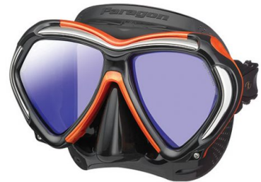
QB-EOA NEW 2019