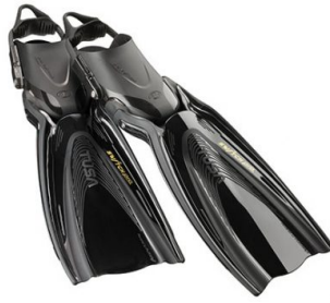
BK NEW 2019