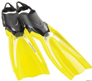
TFY NEW 2019