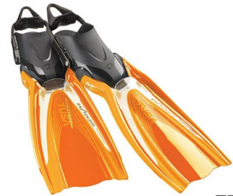
TEO NEW 2019